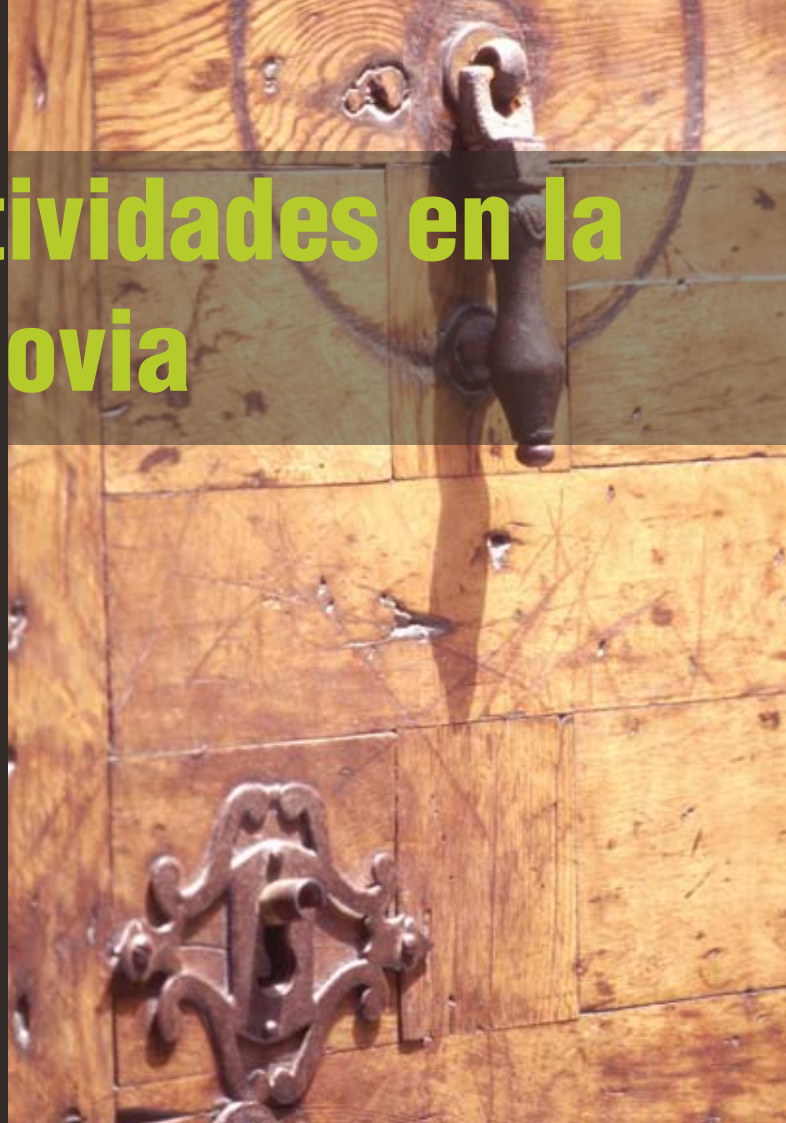
Detalle de una puerta de la Judería de Segovia

La oferta de las actividades es variada en sus propuestas, que pasan por conferencias, talleres, degustaciones, conciertos, y actividades para os más pequeños.