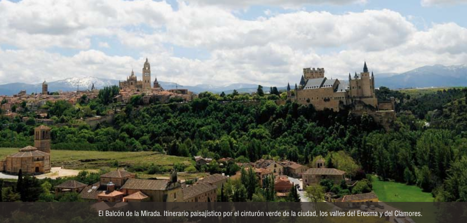
El Balcón de la Mirada. Itinerario paisajístico por el cinturón verde de la ciudad, los valles del Eresma y del Clamores.