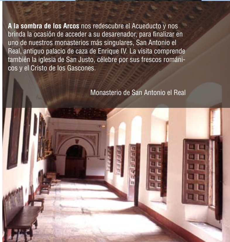
Monasterio de San Antonio el Real

A la sombra de los Arcos nos redescubre el Acueducto y nos brinda la ocasión de acceder a su desarenador, para finalizar en uno de nuestros monasterios más singulares, San Antonio el Real, antiguo palacio de caza de Enrique IV. La visita comprende también la iglesia de San Justo, célebre por sus frescos románicos y el Cristo de los Gascones.