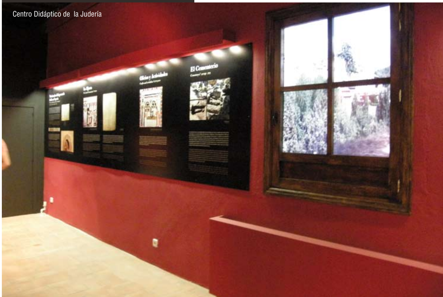
Centro Didáctico de la Judería

Más información Centro de Recepción de Visitantes, tel 921 46 67 20 info@turismodesegovia.com www.turismodesegovia.com www.reservadesegovia.com