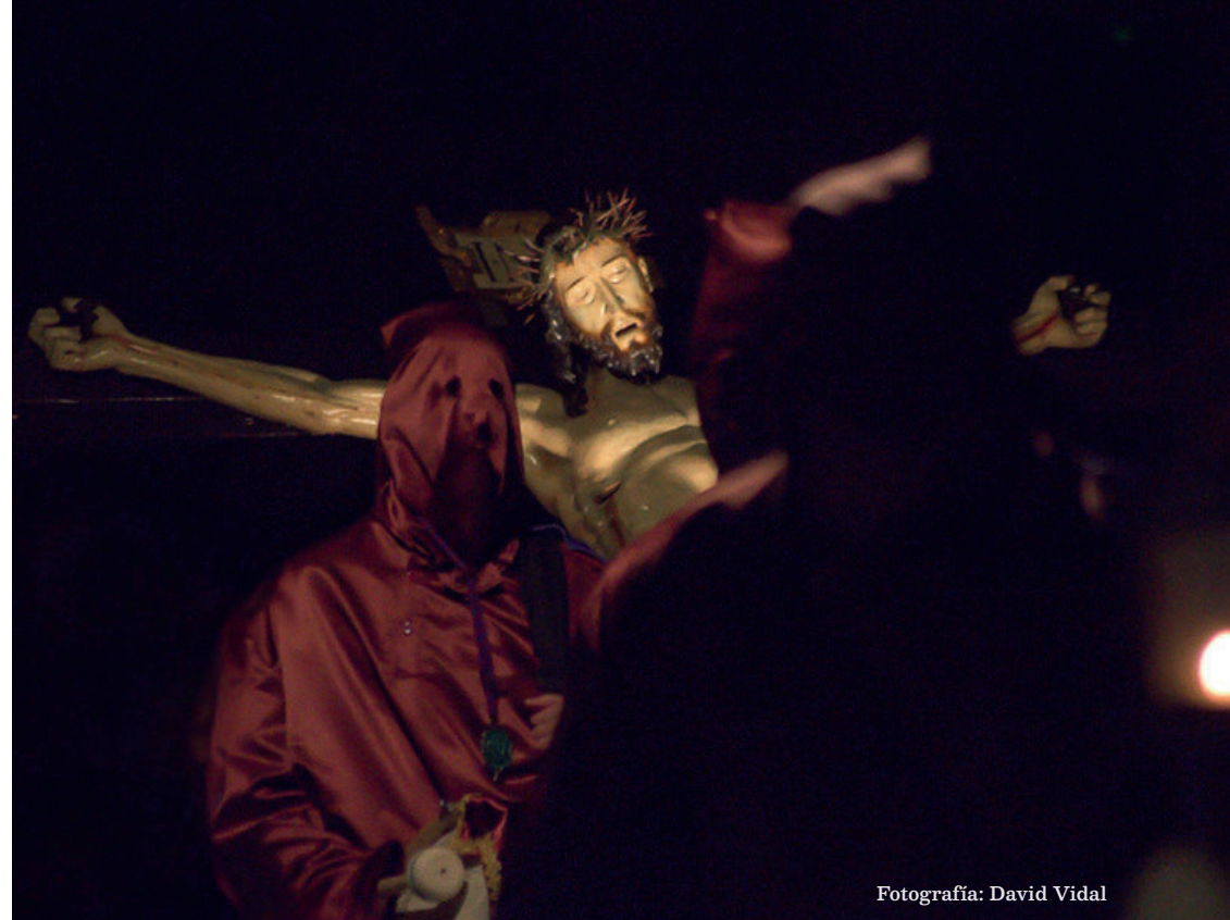
Fotografía: David Vidal